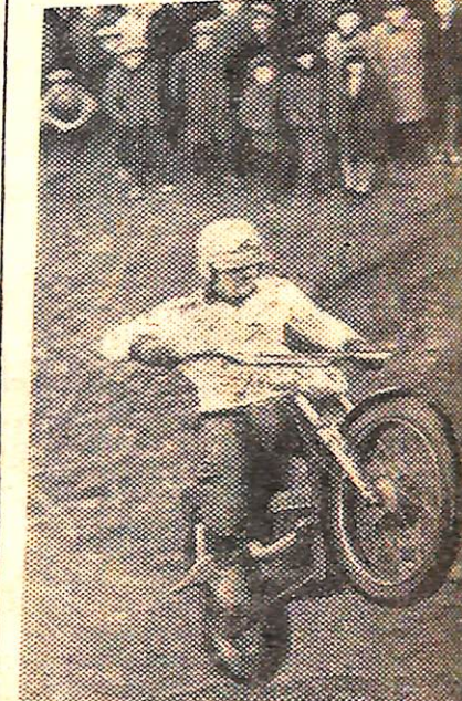
На крутом подъеме.

Несколько слов о популярности мотоспорта в городе. Особенно увлекается молодежь. В секции занимается много подростков-допризывников, среди них можно было бы предсказать хорошую спортивную будущность. Как правило, их отличает настоящая преданность мотоспорту, они одержимы желанием звать высокие результаты, многим из них не хватает знаний, опыта в деле подготовки машин. Гонщик и его машина — это единое целое, единение может быть достигнуто только в результате личного знания машины и опыта в обращении с ней. Об этом нужно постоянно помнить.